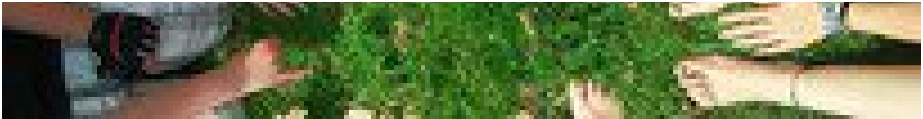
La lunghezza del dito anulare spia della propensione all'alcol