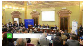
▶ Italia migliora autosufficienza alimentare ma l'import resta alto