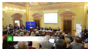
▶ Italia migliora autosufficienza alimentare ma l'import resta alto