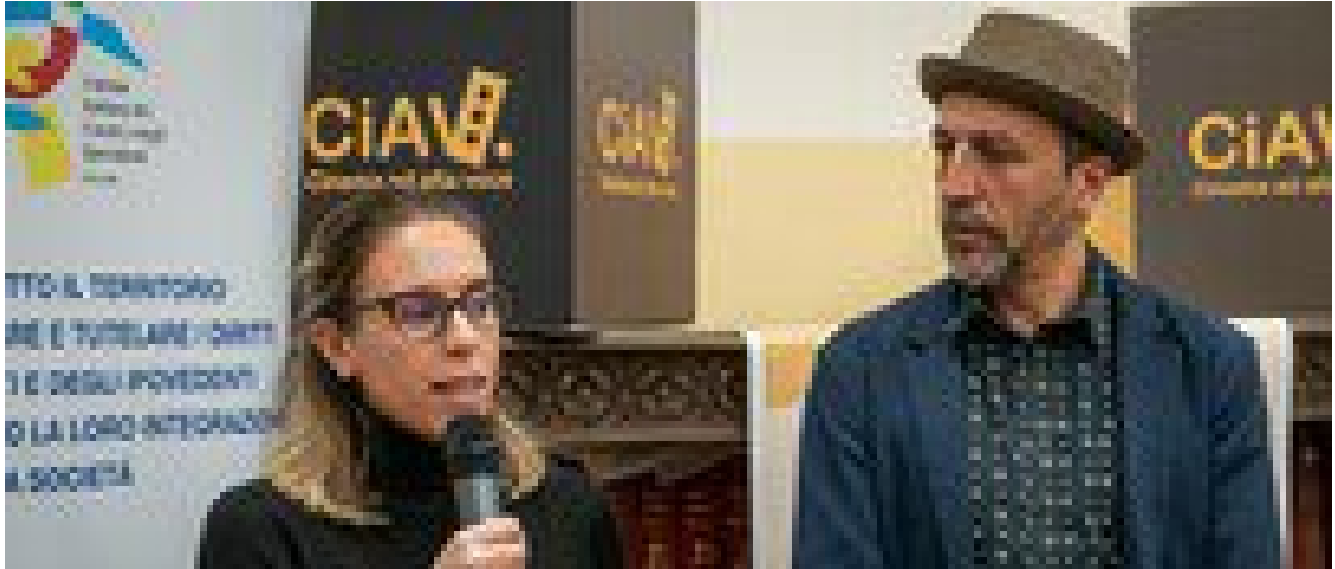
Cinema accessibile, app MovieReading per Ipvodenti