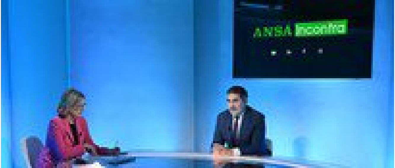
La transizione complessa, tra sostenibilità e competitività