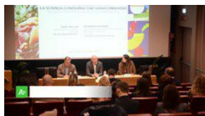
▶ Carni sostenibili, "la scienza conferma che siamo onnivori"