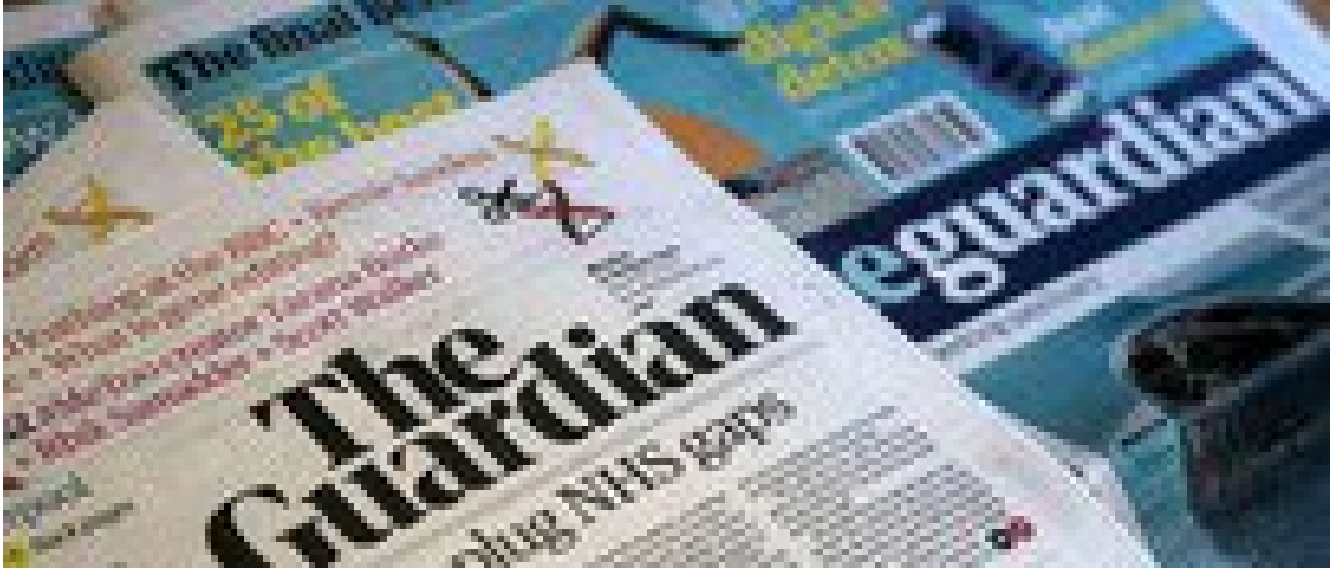
I giornalisti del Guardian in sciopero, è la prima volta in 50 anni