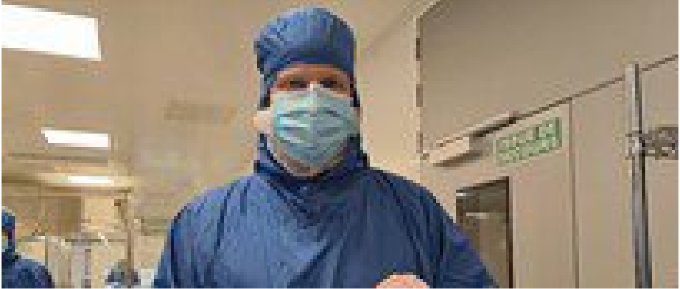
Un Cuore artificiale permanente, al via i primi impianti sperimentali nel 2025