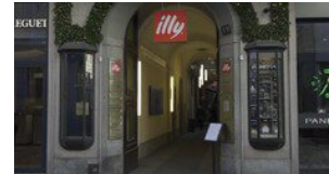
▶ Milano, due nuovi piatti a base di caffè' a illy Monte Napoleone