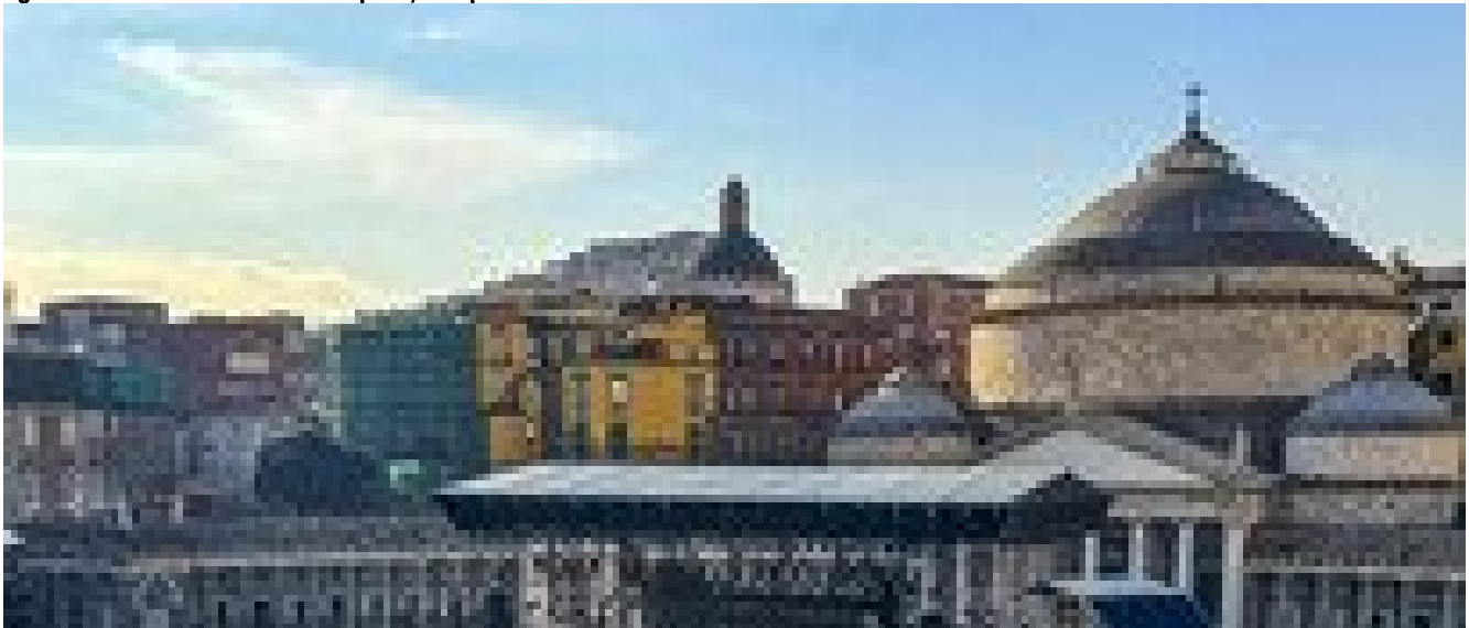
Attesa per la finale di X Factor, domani da piazza del Plebiscito a Napoli