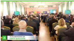
▶ Dop Economy, "cruciale proteggere la qualita' made in Italy"