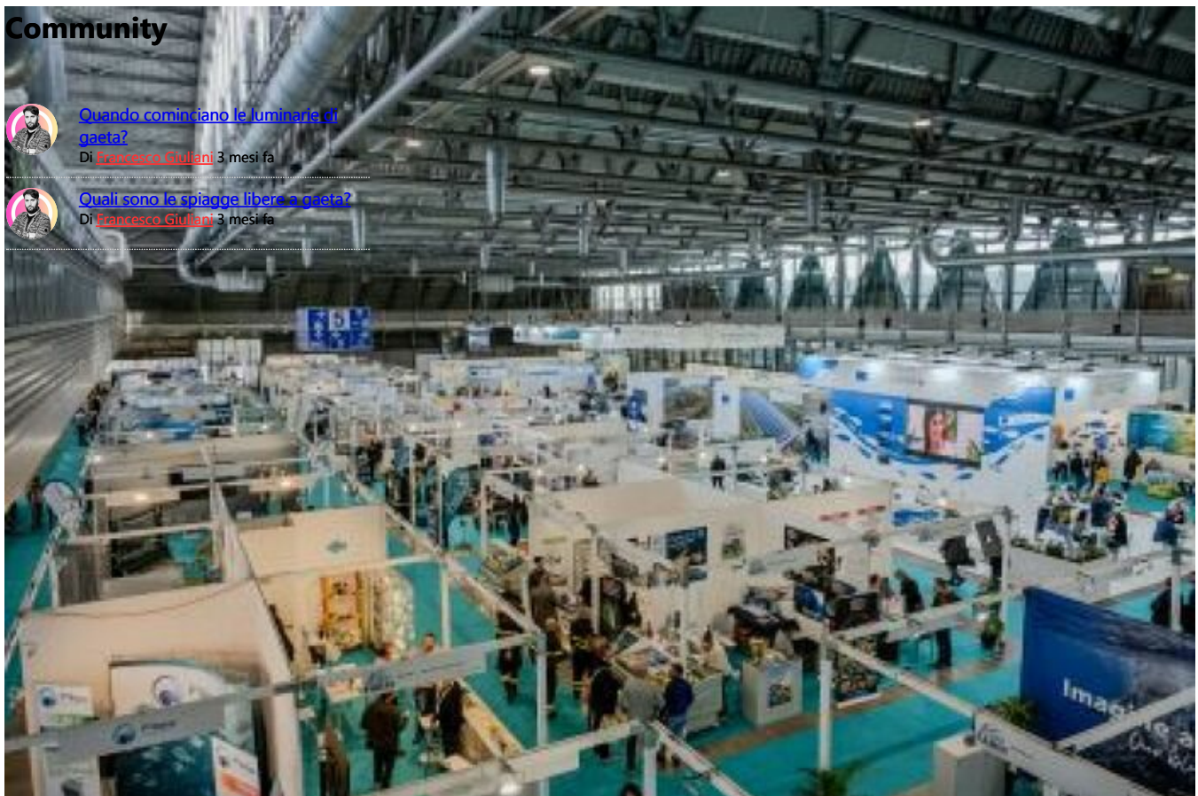
Fatturato dell'itticoltura italiana nel 2023: oltre 400 milioni di euro senza molluschi - Gaeta.it