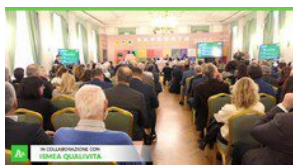
▶ Dop Economy, "cruciale proteggere la qualita' made in Italy"