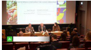
▶ Carni sostenibili, "la scienza conferma che siamo onnivori"