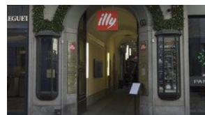
▶ Milano, due nuovi piatti a base di caffe' a illy Monte Napoleone