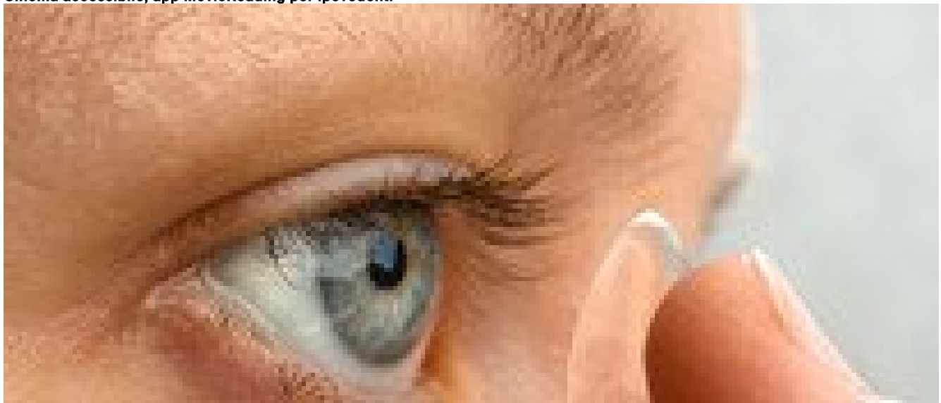
Allerta oculisti per la cheratite, Infezione da cattivo uso lenti