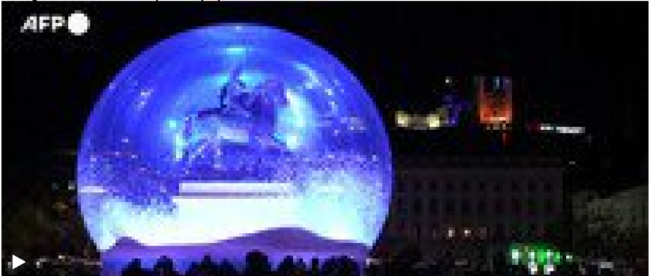
Francia, a Lione il Festival delle luci celebra il 25esimo anniversario