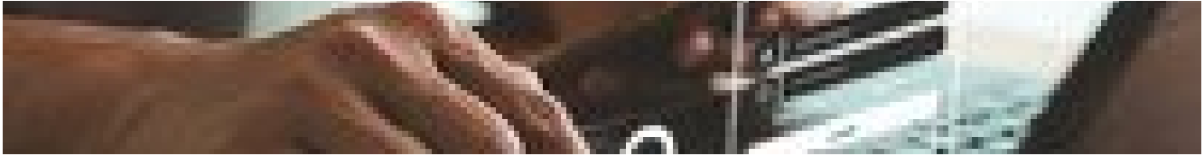
Testi brevi e lessico povero, come anche i social hanno cambiato linguaggio nel tempo